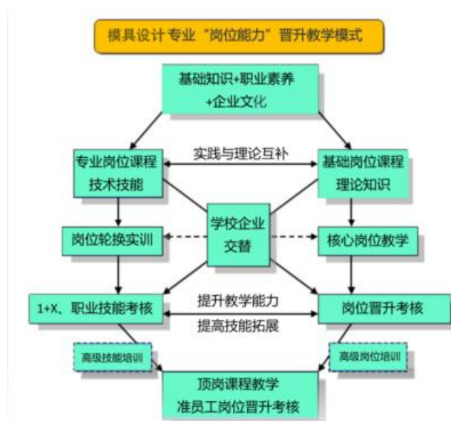
图2 工学交替、岗位晋升教学模式

术技能和工作岗位能力逐级晋升。学校机电系与沈阳沈飞民品有限公司签订了校企合作战略协议，探索成立“沈飞民品技术应用”二级学院，深入开展校企联合办学的教学改革创新模式，与沈阳飞机工业（集团）有限公司签订全面合作协议，开展“沈飞订单班”教学改革创新模式。